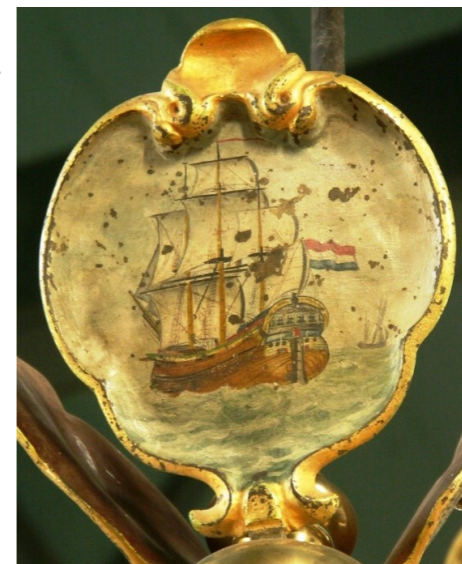
Koperen kroonluchters van ± 1668

Een reder gaf altijd een flink bedrag aan de diaconie. Verging er een schip dan was men verzekerd dat de kerk het gezin onderhield van zijn bemanning.