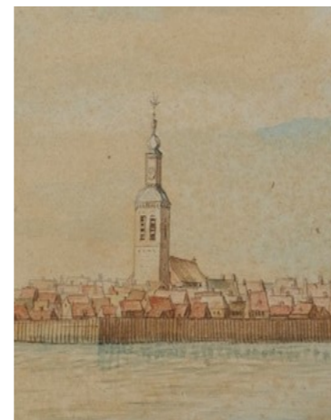
Toren voor 1701

In 1734 werd de toren herbouwd, zoals zij nu is, (lantaarn toren) naar een ontwerp van Claes Piters (alleen houten gedeelte). Omdat men er zo gauw bij was, kon men een grote brand voorkomen.